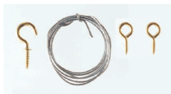
●洋灯吊：1ヶ ●丸ヒートン：2ヶ ●ワイヤー7本撚り：90cm