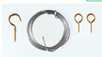
●洋灯吊：1ヶ ●丸ヒートン：2ヶ ●ワイヤー7本撚り：60cm